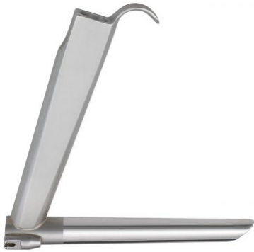
fig. 6; Ø 13x18mm; 182mm